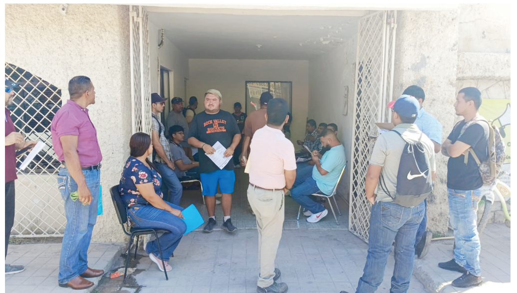
Decenas de personas acudieron al llamado para solicitar un empleo a la empresa FERVIM Ingeniería.

Entre los puestos disponibles se encuentran chofer de quinta rueda, chofer de tres toneladas y media, chofer de torton, carnicero, cajero, soldados paileiros, mecánicos de gasolina y diésel, y albañilería. La jornada de reclutamiento se realizó ayer lunes en las oficinas del Servicio Estatal del Empleo a donde se dieron cita decenas de personas para solicitar un puesto de acuerdo a sus capacidades.