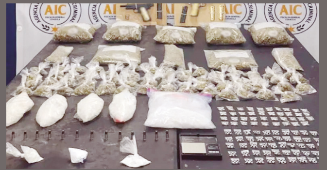
En el municipio de Acuña, fueron localizadas dos armas de fuego, municiones, droga y un inmueble.

Las cifras oficiales también reportan el aseguramiento de 26 mil 643