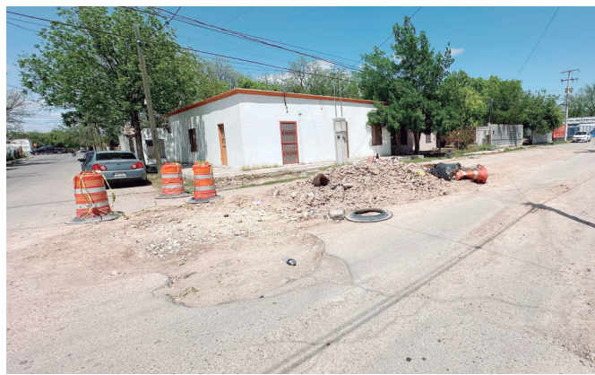
Durante semanas, permanece obra de SIMAS llena de escombros y calle en mal estado en Villa de Fuente.

nicipal de Aguas y Saneamiento (SIMAS) sobre la calle Zaragoza, esquina con Hidalgo, en el sector de Villa de Fuente, sigue inconclusa, generando malestar entre los vecinos y automo-