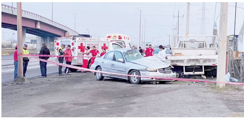
Mueren dos jóvenes en choque contra plataforma de camión.