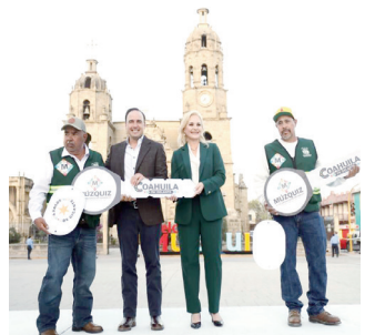
Entrega Gobernador camiones recolectores a Múzquiz

De esta manera, habrán de trabajar en coordinación, sumando esfuerzos