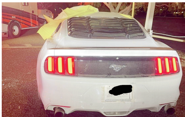
EN EL LAGO DE E. PASS

Jiménez Salinas dio a conocer a las alcaldes y alcaldes electos el trabajo que desde el gobierno estatal se realiza en todos los municipios, en los que destacó las grandes obras insignia en cada región, la inversión de 700 millones de pesos en seguridad y el gran programa de Salud Popular, entre otros que llegan a los 38 municipios de Coahuila.