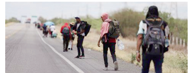
A TRAVÉS DE LAS FERIAS ESTATALES