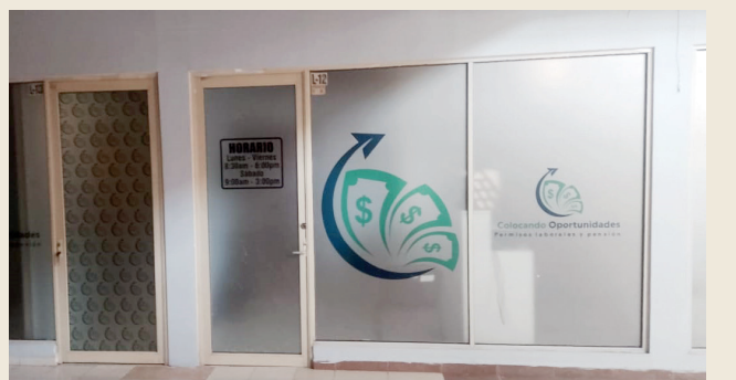
Los denuncian por estafadores "Colocando Oportunidades"