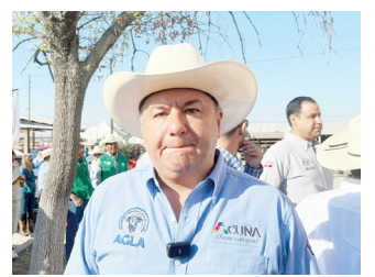
Señaló el secretario que quieren subir a estatus número 3.

cabezas de ganado el año pasado. A pesar de haber enfrentado años de sequía