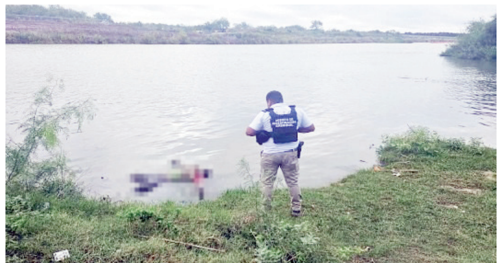
Encuentra cuerpo de persona flotando en el río Bravo.

De acuerdo a las autoridades, dijeron que pudiera ser un migrante que buscaba el sueño americano