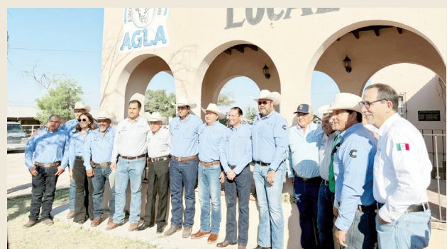
Dan apoyo estado y municipio a ganaderos.

CIUDAD ACUÑA, COAH. - En un esfuerzo por fortalecer el sector ganadero del norte del Estado, el gobierno de Coahuila, en conjunto con el municipio de Ciudad Acuña, dio inicio al programa de mejoramiento genético destinado a los ganaderos locales y de la región.