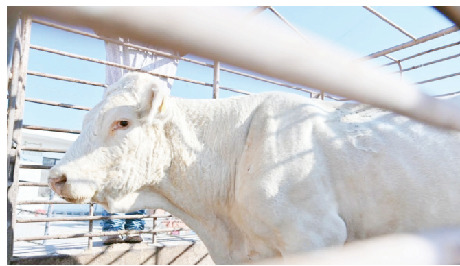
Buscan mejora de ganado.

Coahuila es actualmente el tercer estado con mayor