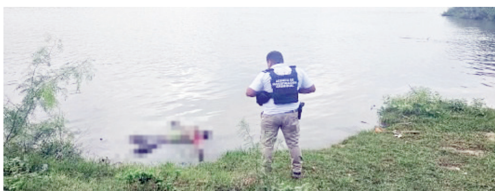
Encuentra cuerpo de persona flotando en el río Bravo.

Elementos del Grupo Beta, la Policía Civil de Coahuila y la Agencia de