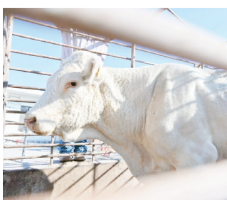
Buscan mejora de ganado.

Es actualmente el tercer estado con mayor aportación de ganado al extranjero