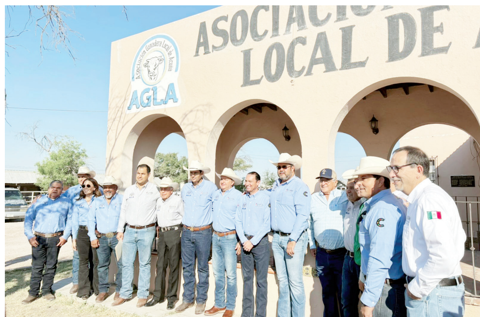
Dan apoyo estado y municipio a ganaderos.

apoyar la compra de ganado mediante un subsidio de 30 mil pesos, financiado por el estado y el municipio, para facilitar la adquisición de sementales de alta calidad. La finalidad es que los ganaderos puedan acceder a mejores ejemplares, lo que a largo plazo se traducirá en una