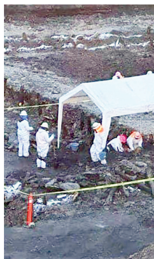
El cadáver fue ubicado en la galería GWE10-Oeste