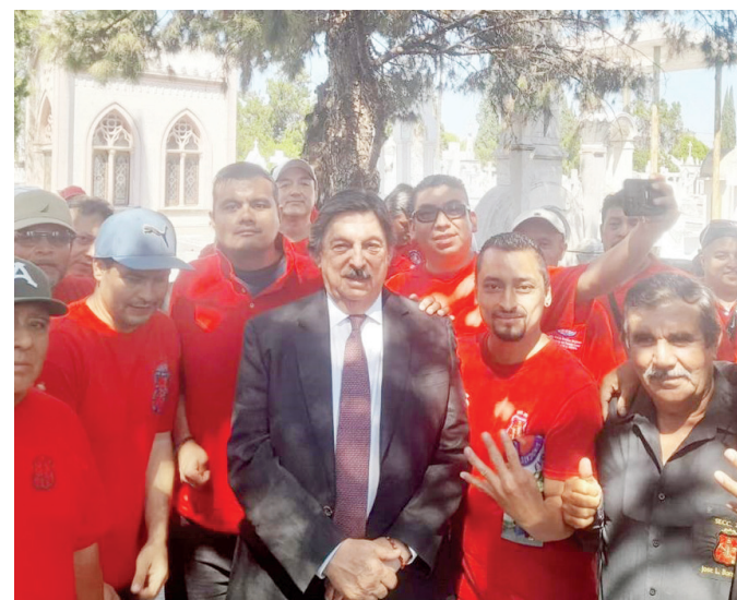
Señala Napoleón Gómez Urrutia que es falso que existan inversionistas interesados en Ahmsa.

“Los charros han engañado a los trabajadores con promesas de inversión extranjera, mencionando chinos, coreanos, rusos y estadounidenses, pero todo ha sido un fraude”