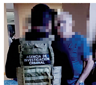
Daniel N fue trasladado a un hospital de la localidad donde falleció.