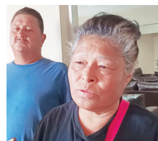
Señalan que dejará un gran vacío en su familia.

El día de ayer se llevó a cabo el velorio de Sugeheidi