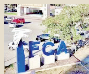
UAC Investiga 42 Casos de Acoso: Rector Anuncia Cero Tolerancia.

La institución ha adoptado una política de cero tolerancia contra cualquier tipo de agresión