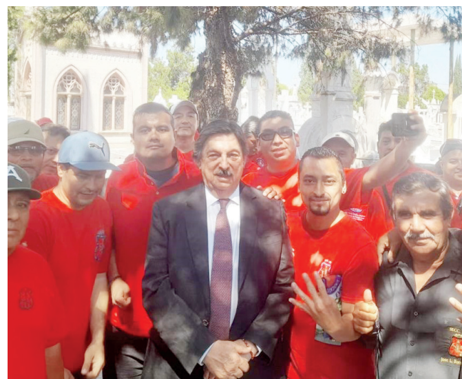
Señala Napoleón Gómez Urrutia que es falso que existan inversionistas interesados en Ahmsa.