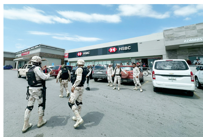
EN BANCO HSBC