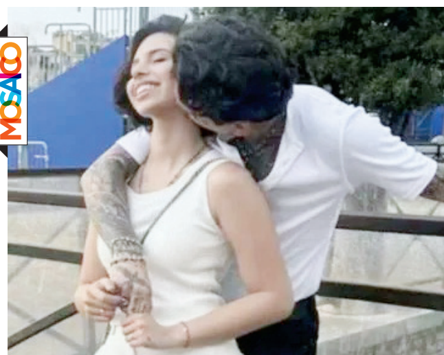
CHRISTIAN NODAL Y ÁNGELA AGUILAR