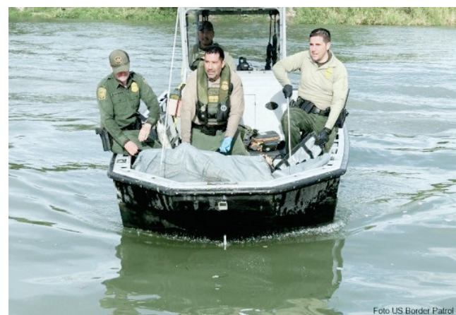
EN EL SHELBY PARK