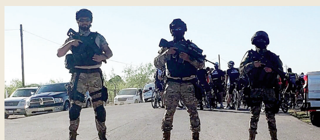
Fiscalía del Estado Continúan Resguardando las Fronteras.

El hermano de Joaquín resultó con serias lesiones