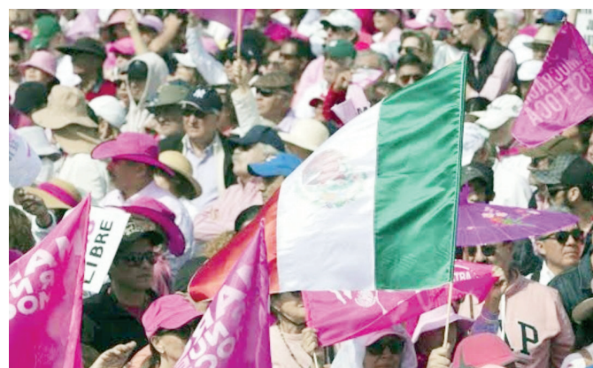
Invitan a participar en la marcha por la democracia.