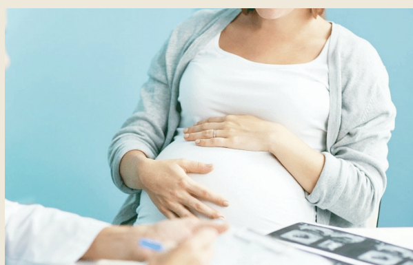
En aumento casos de preeclampsia en embarazadas.