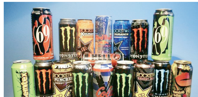
Alertan por bebidas energizantes grave daños a la salud.