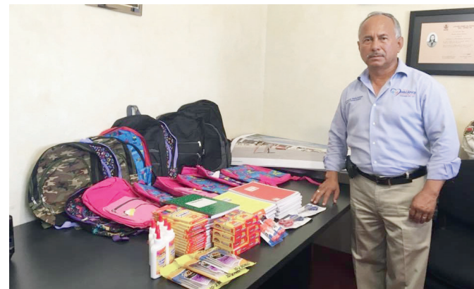
Un hombre cuya bondad y disposición para ayudar al prójimo siempre serán recordadas y admiradas.

como persona, siempre ha sido mi ejemplo, yo quiero que el este orgulloso siempre de mí, así como lo estoy de él, yo soy su primera nieta y desde los 3 años, íbamos juntos al cine, me compro mi primer coche a los 15 años, después de su diagnóstico, nos unimos más como familia"