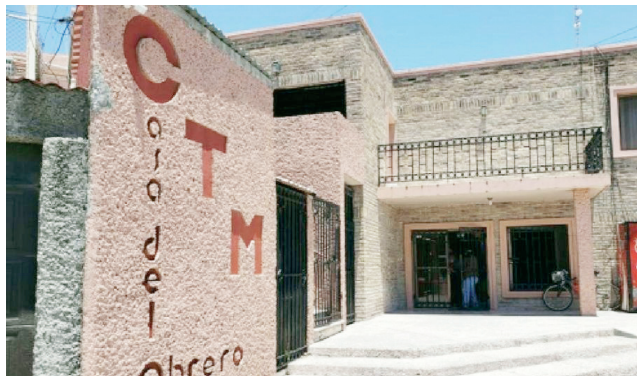
CTM continúa diálogo con extrabajadores.