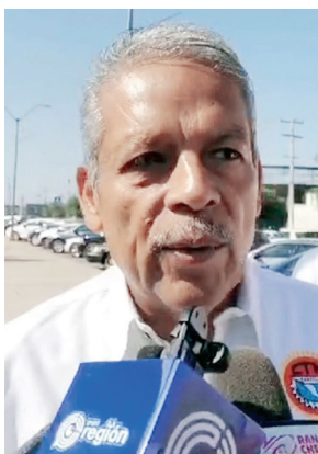
Siguen adelante con auditorías en la CTM.

Se mantiene la auditoría y negociación con ex empleados para llegar a un acuerdo justo y sean liquidados conforme a la ley