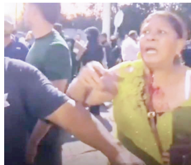
Otra ciudadana quedó ensangrentada en el zafarrancho.

Clausura Gobernador de Coahuila Tercer Foro Inmobiliario del Norte en Torreón