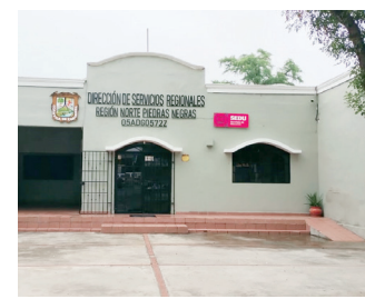
vidades al aire libre, incluyendo la clase de educación física”, señaló Estrada.

“Las clases continúan de manera normal. Las únicas medidas que han tenido modificaciones son los horarios de recreo y las acti-