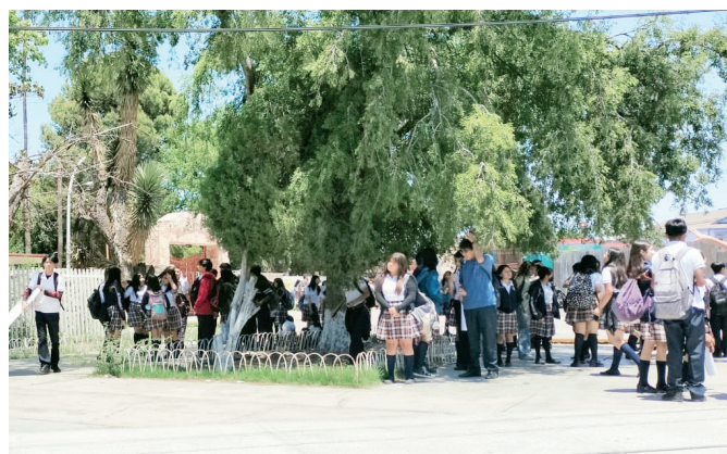
No hay suspensión de clases por ola de calor.

cuelas de kínder, primaria y secundaria se encuentran en óptimas condiciones para recibir y atender a los alumnos.