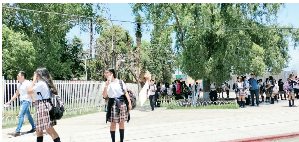
Se realizan revisiones a instalaciones eléctricas en los planteles educativos.