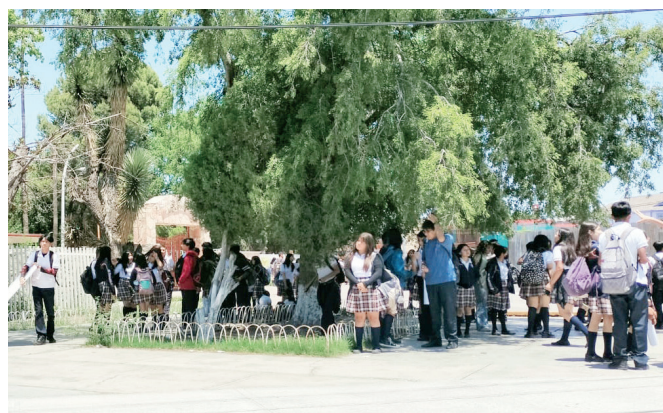
No hay suspensión de clases por ola de calor.

cuelas de kínder, primaria y secundaria se encuentran en óptimas condiciones para recibir y atender a los alumnos.