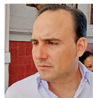
El gobernador de Coahuila, Manolo Jiménez Salinas.

“Recientemente tuve una reunión para abordar