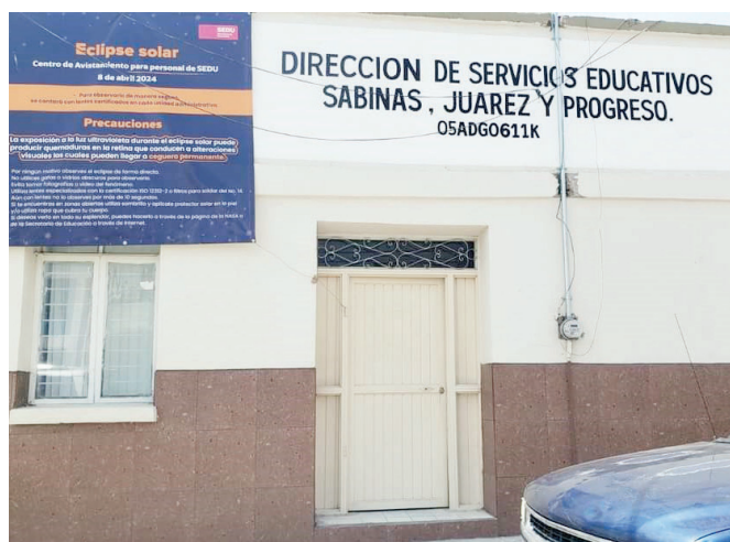
Podrán Acortar Horario Escuelas Ante Ola de Calor

6 Son 101 instituciones en esta región Sabinas Juárez y progreso de educación básica que son preescolar primaria y secundaria inicial y especial, todos ellos entran dentro de este comunicado que les hace llegar el secretario de educación para acatar las reglas y normas, y no poner en riesgo a los pequeños y nuestros adolescentes”.