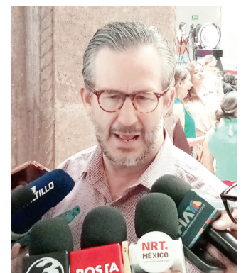
Emanuel Garza Fishburn, titular de la Secretaría de Educación en Coahuila.

Por ello es que la dependencia enfrenta múltiples desafíos en más de 70 planteles educativos debido al aumento de las temperaturas correspondientes a la segunda ola de calor del año. Golpes de calor, cortes de luz y plagas de chinches son algunas de las situaciones que están siendo atendidas por las autoridades