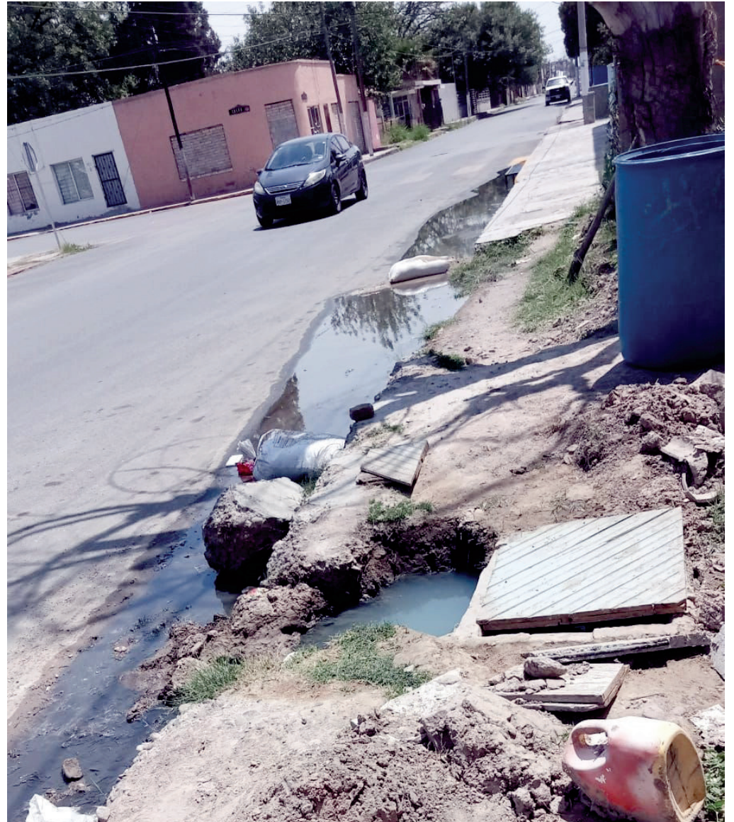
Vecinos de Mundo Nuevo solicitan reparación urgente de fuga de aguas negras.

Hasta el momento, ni el municipio ni el personal de SIMAS han atendido el reporte realizado por los vecinos, lo que ha provocado un malestar creciente en la comunidad. La situación se agrava debido a los riesgos para la salud que representa la fuga de aguas