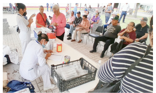
Paciente contagiado de COVID recibe tratamiento sin complicaciones.