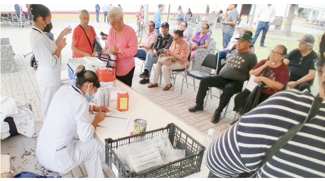
Paciente contagiado de COVID recibe tratamiento sin complicaciones.