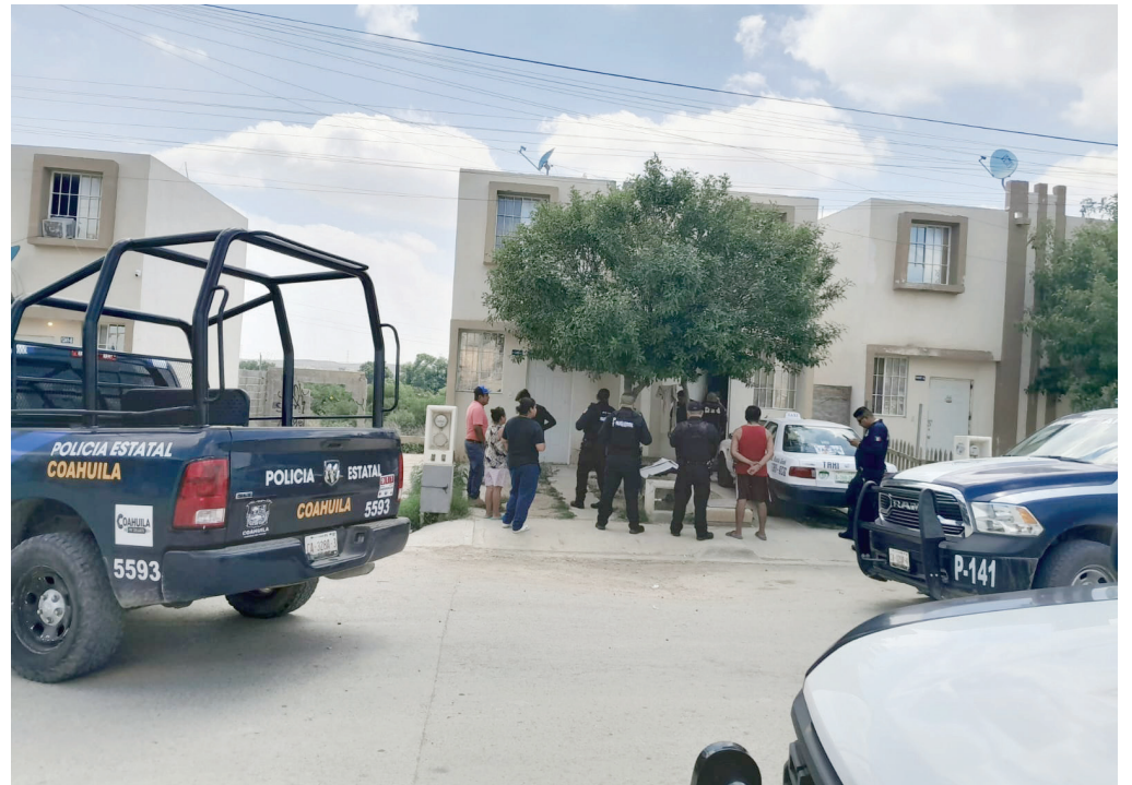
Se suma un suicidio más en el municipio.