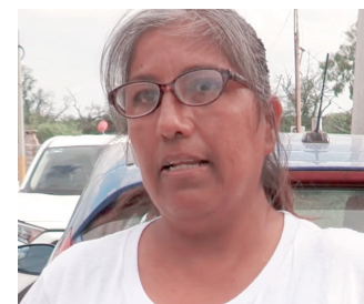
Familias afectadas por socavón ven incrédulos como su patrimonio se cae a pedazos.

de drenaje está en un 80 por ciento de avance, pero reconoció que la inestabilidad del terreno ha provocado frecuentes derrumbes en la calle Industrial de la colonia Bravo.