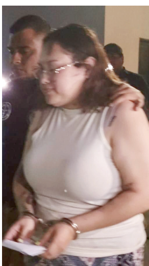
Detienen a mujer responsable.