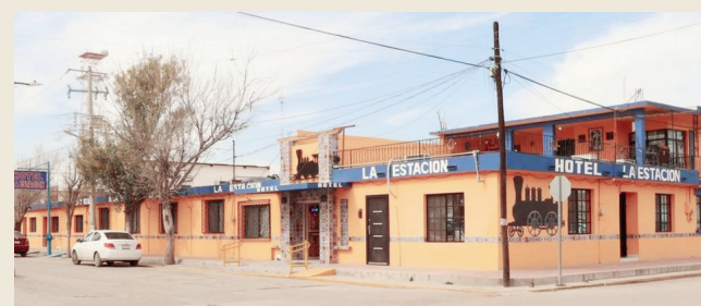
Uno de los Hoteles sobrevivientes

En su vasta experiencia opina que los motivos también pudieran ser por la alta inflación, ya que la Región Carbonífera está en una situación muy distinta a todo el resto del estado, por la disminución de la venta del carbón.