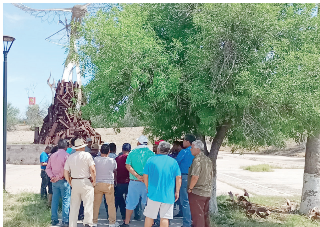
Por falta de condiciones de seguridad se suspende reunión con obreros.

“Recibieron una llamada por parte de sus jefes en la Secretaría del Trabajo,