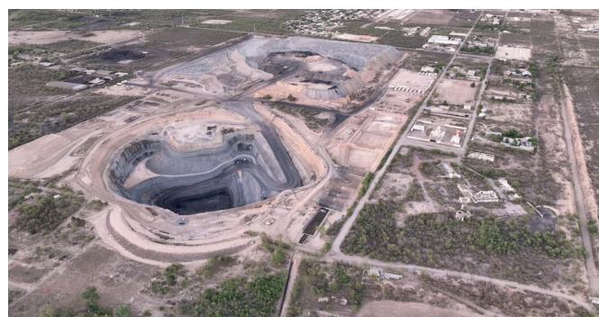
Equipo protección civil en Risa de Oro

Unificado, que coordina el trabajo conjunto para la recuperación de los mineros de la mina El Pinabete, conformado por la Comisión Federal de Electricidad (CFE), la Coordinación Nacional de Protección Civil (CNPC), la Secretaría de la Defensa Nacional (Sedena) y la Fiscalía General del Estado de Coahuila, informó a las familias de los deudos los resultados de identificación de los indicios biológicos recuperados.